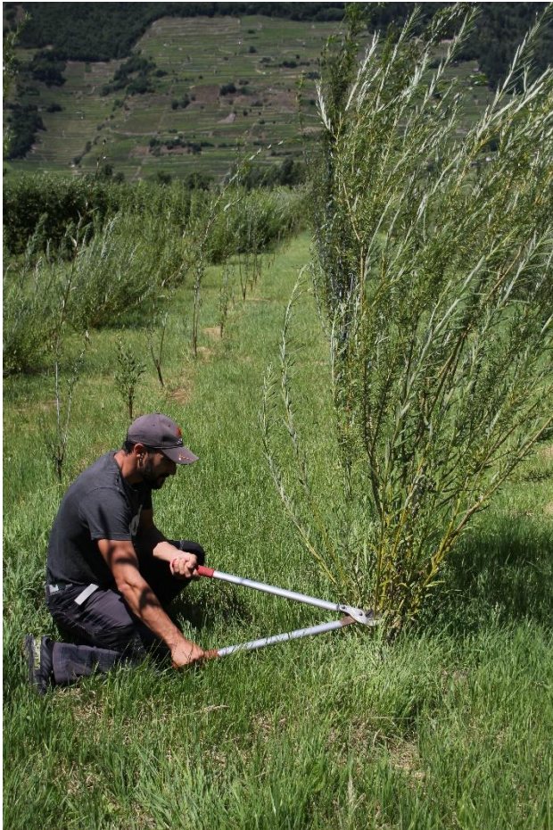
Photo 1 Récolte de bouture