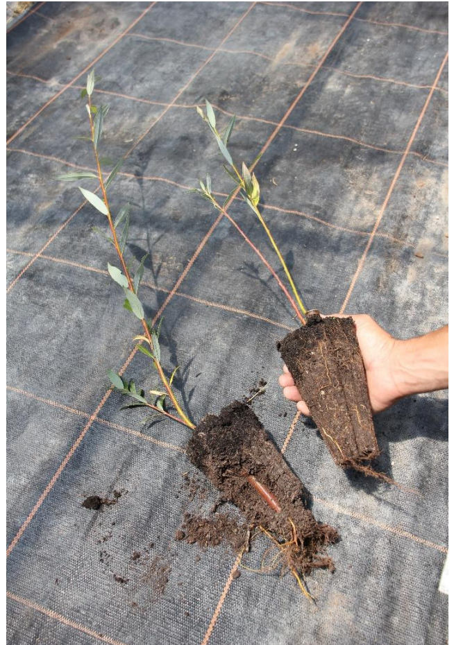
Photo 3 Boutures de saules enracinées