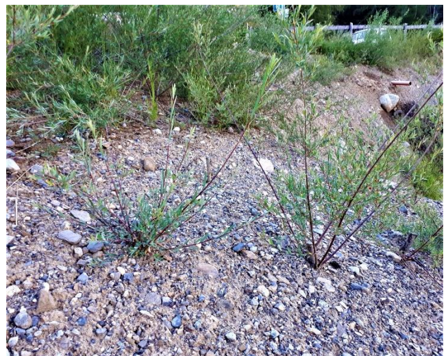
Bouture de saule plantée