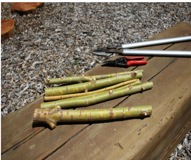
Photo 2 Bouture de saule